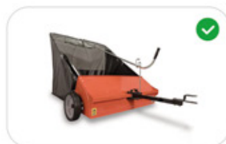
Scopa da prato