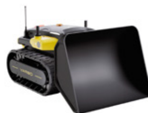
YARBO SPALLA NEVE

Raccolta e soffiaggio di foglie e detriti