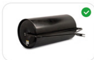
Rullo per prato